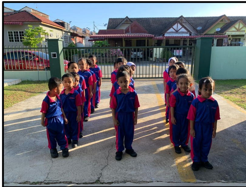
Kanak-kanak di bahagikan kepada tiga kumpulan